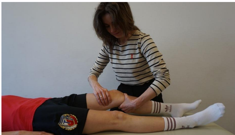
Kuva 2. Lachmannin testi

Tutkittava makaa selällään ja terapeutti seisoo lepotuolin vieressä testattavan alaraajan puolella. Terapeutti vakauttaa reittä ventraaliselta puolelta yhdellä kädellä, vakauttaa alaraajan dorsaaliselältä puolelta toisella kädellä ja taivuttaa testattavan polven noin 15-30 o kulmaan. Terapeutti yrittää sitten ojentaa sääriluuta eteenpäin suhteessa reiteen. Etummaisesta ristisiteen vaurioitumisesta on osoituksena säären yli 5 mm:n venytys eteenpäin ja pehmeä vastus. Koehenkilön on rentoutettava lihakset mahdollisimman paljon testin aikana.