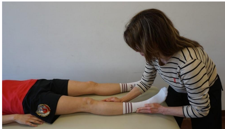
Kuva 8. Varus testi