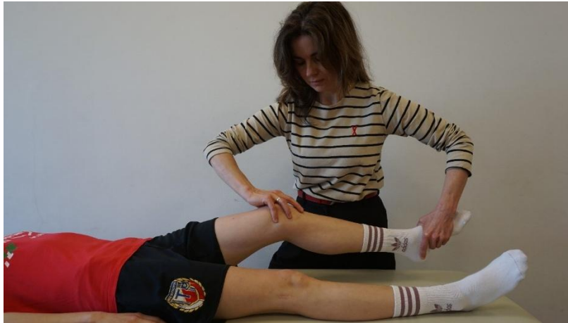
Kuva 3. Pivot-shift testi