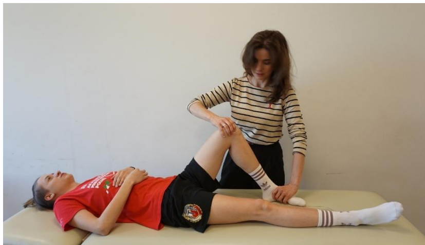
Kuva 16. Polvinivelen arkuuskoe lateraalisen meniskin osalta.