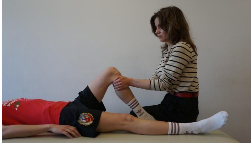
Kuva 1. Anteorinen vetotesti