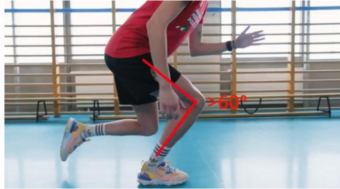
Kuva 17. Yhden jalan kyykkytesti