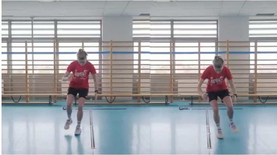
Kuva 21. Yhden jalan kolminkertainen Crossover Hop testi