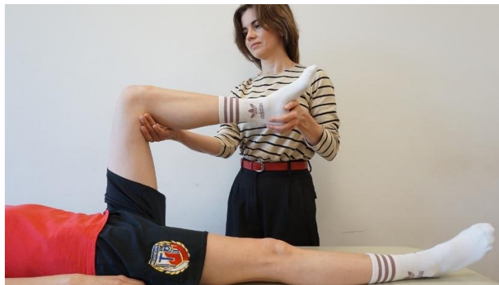
Kuva 4. painovoima pudotus-testi

Tutkittava makaa selällään ja terapeutti seisoo lepotuolin vieressä testattavan alaraajan puolella. Terapeutti taivuttaa testattavan raajan 90 asteen kulmaan lonkasta ja polvesta siten, että toinen käsi tukee jalkaa ja toinen käsi pitää alaraajasta kiinni juuri polvinivelen alapuolella. Terapeutti ottaa sitten käden pois polven alueelta ja tarkkailee, laskeeko sääriluu ja muuttuuko polvinivelen ääriiviivat. Tämä reaktio on merkki takimmaisen ristisiteen vaurioitumisesta.