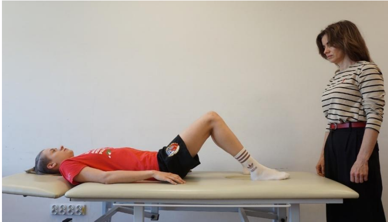
Kuva 5. Back drop testi