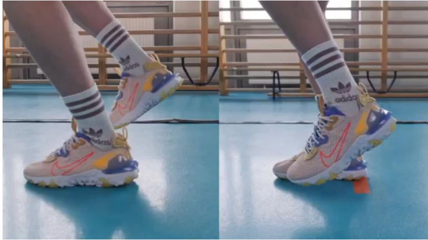
Kuva 19. Yhden jalan kolmoishyppytesti