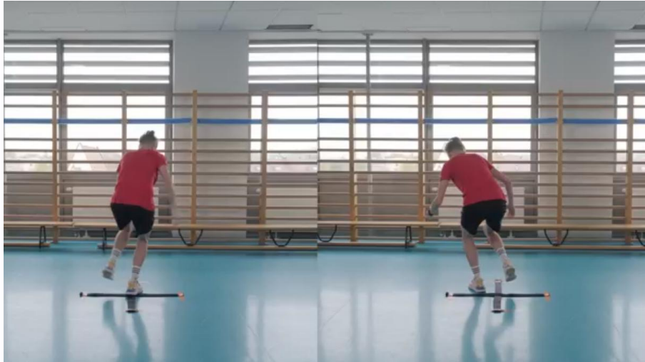
Kuva 25. Yhden jalan mediaalinen pyörivä hyppytesti