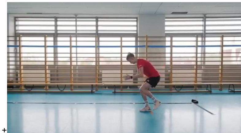
Kuva18. Yhden jalöan eteenpäin hyppytesti

Urheilija seisoo merkityllä viivalla ja hyppää yhden jalan asennosta mahdollisimman pitkälle laskeutuen samalle jalalle. Laskeutumisen jälkeen urheilijan on säilytettävä tasapaino. Testi suoritetaan molemmilla jaloilla. Tehtävä katsotaan hyväksytyksi, jos hyppyyn osallistuvalla jalalla laskeutuneen hypyn etäisyys on vähintään 90 % hyppyyn osallistumattoman jalan tuloksesta.