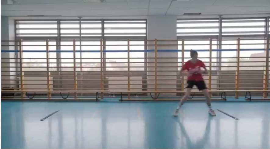
Kuva 27. Edgrenin sivuaskel-testi (ESST)

Yhteenvetona voidaan todeta, että ei pidä unohtaa, kuinka tärkeää on varmistaa urheilijan valmius palata pelaamaan ennen testausta. Hoitavan lääkärin mukaan urheilija voidaan testata, jos lihasvoima ja liikelaajuus ovat kunnossa, urheilija ei tunne kipua levossa eikä liikkeessä, turvotusta tai muita häiritseviä oireita ei ole ja kävely ja juoksu ovat normaalit eli ilman kipua, epävakauden tunnetta tai kompensatiota. Ei ole selkeästi määritelty, kuinka monta testiä olisi tehtävä, mutta on tärkeää, että ne eivät ole vain eteenpäin hyppäämisestä koostuvia testejä. Testit, joihin sisältyy hyppyjä sivulle, mediaalisesti ja rotaatioiden kanssa, voivat osoittautua ratkaisevan tärkeiksi. Myös urheilijan psykologiset valmiudet ovat tärkeitä. Ei pidä unohtaa, että paluu urheiluun ei ole sama asia kuin paluu kilpailuun. Kilpaileminen edellyttää täysien harjoittelujaksojen sietämistä vastustajien kanssa ja kontaktia (jos laji vaatii sitä, esim. judo).