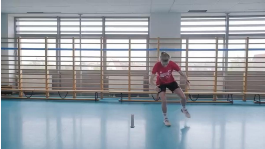
Kuva 23. Yhden jalan mediaalinen hyppytesti