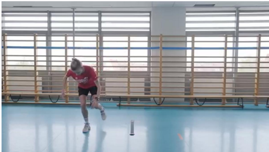
Kuva 22. Yhden jalan lateraalinen hyppytesti

Urheilija seisoo yhdellä jalalla merkityllä viivalla ja hyppää sivulle niin pitkälle kuin mahdollista laskeutuen samalle jalalle. Laskeutumisen jälkeen urheilijan on säilytettävä tasapaino. Tehtävä katsotaan hyväksytyksi, jos mukana olevalla jalalla laskeutuneen hypyn pituus on vähintään 90 % mukana olevalla jalalla saavutetusta tuloksesta.