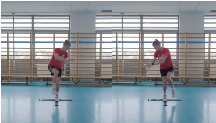
Kuva 24. Yhden jalan sivuttainen pyörivä hyppytesti

Urheilija seisoo merkityllä viivalla yhdellä jalalla, hyppää ylöspäin, pyörii ilmassa sivuttain ja laskeutuu samalle jalalle. Laskeutumisen jälkeen urheilijan on säilytettävä tasapaino. Tehtävä katsotaan hyväksytyksi, jos urheilija pystyy suorittamaan vähintään 90 % rotaatiosta, jonka hän on saanut tekemättä jääneellä jalalla, kun hän hyppää tekemättä jääneellä jalalla.