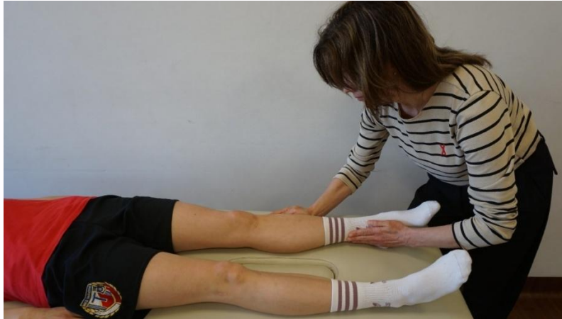
Kuva 7. Valgus stressi testi