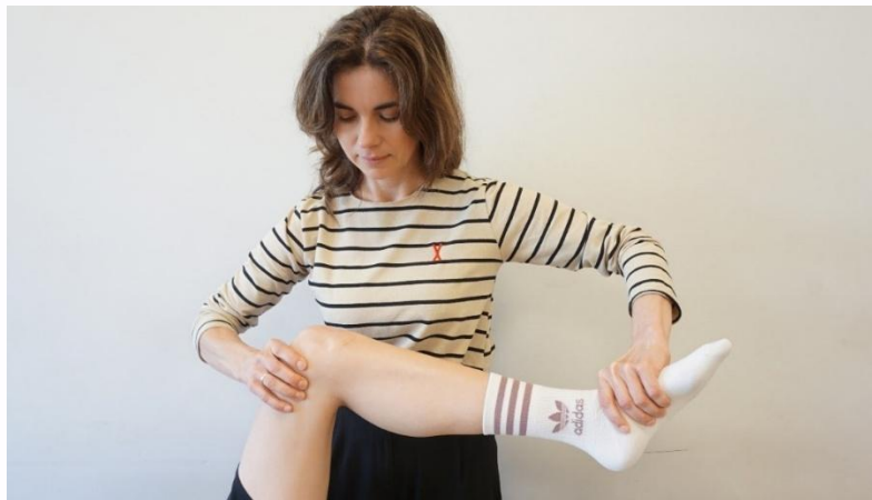
Kuva 10. Bragardin testi lateraaliselle kierukalle