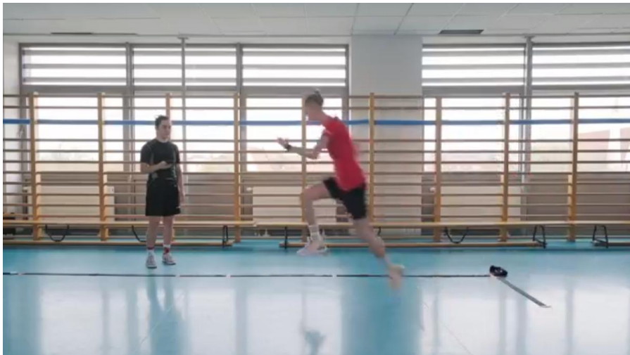
Kuva 20. Ajastettu 6 metrin yhden jalan hyppytesti

Urheilija seisoo yhdellä jalalla merkityllä viivalla ja hyppää mahdollisimman nopeasti laskeutuen samalla jalalla 6 metrin päässä olevalle viivalle. Urheilijan on säilytettävä tasapaino testin aikana. Tehtävä katsotaan hyväksytyksi, jos 6 metrin matkaan kulunut aika hyppäämällä mukana olevalla ja mukana olevalla jalalla eroaa enintään 10 %.